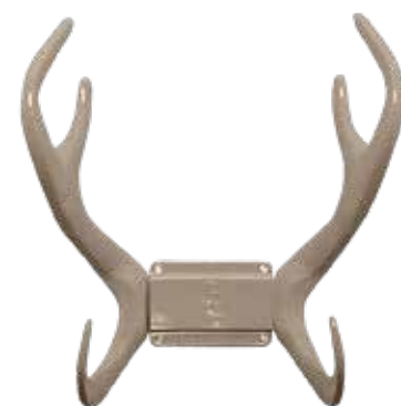
BEIGE ITEM NO. 19633