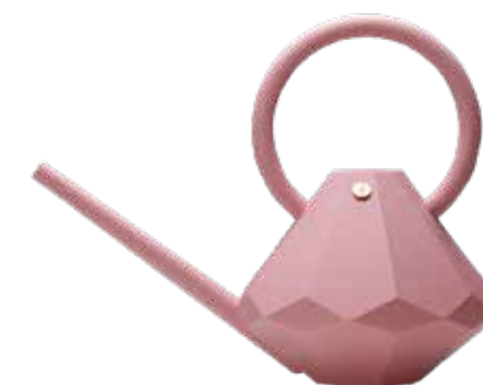
RUSTY ROSÉ ITEM NO. 109