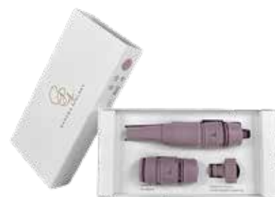
PURPLE RAIN ITEM NO. 197