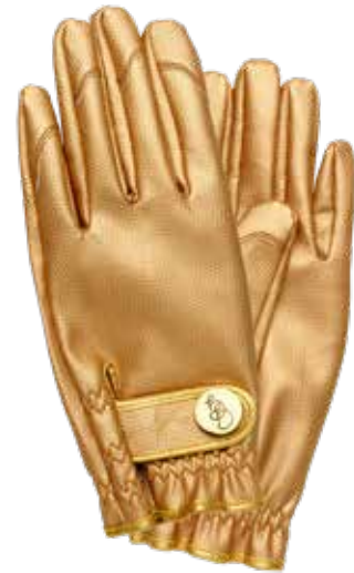
GOLD DIGGER ITEM NO. 95 (S) ITEM NO. 96 (M) ITEM NO. 97 (L) ITEM NO. 192 (XL)