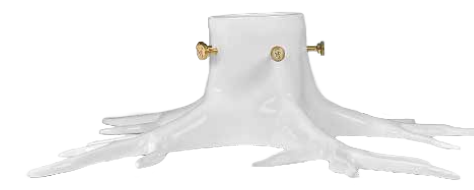
CHRISTMAS TREE STAND LARGER ITEM NO. 19630

US. Limited Edition! Christmas Tree Foot in Silver for the grand homes that just loves a large tree! A natural, organically formed Christmas tree foot that compliments your tree perfectly. With its twisting, mesmerizing root design and strong, stable construction, it's sassy, sexy and already destined to become a holiday classic. Order now before they sell out and enjoy lots of compliments from your Christmas guests this year and many more to come.