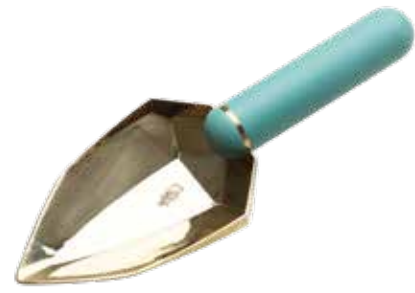
JADE ITEM NO. 64