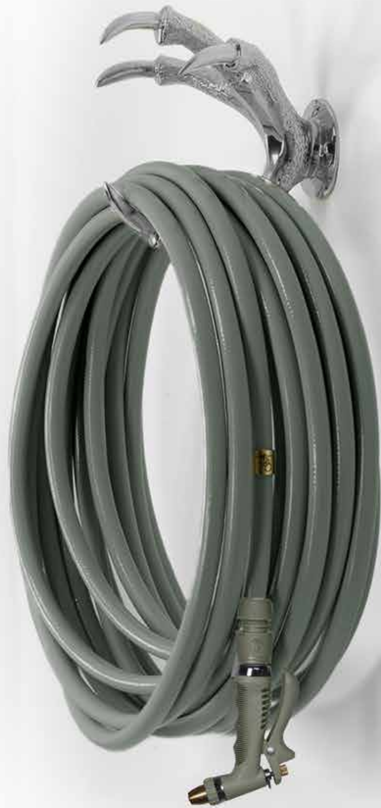
SILVER CLAW HOSE HOLDER ITEM NO. 107