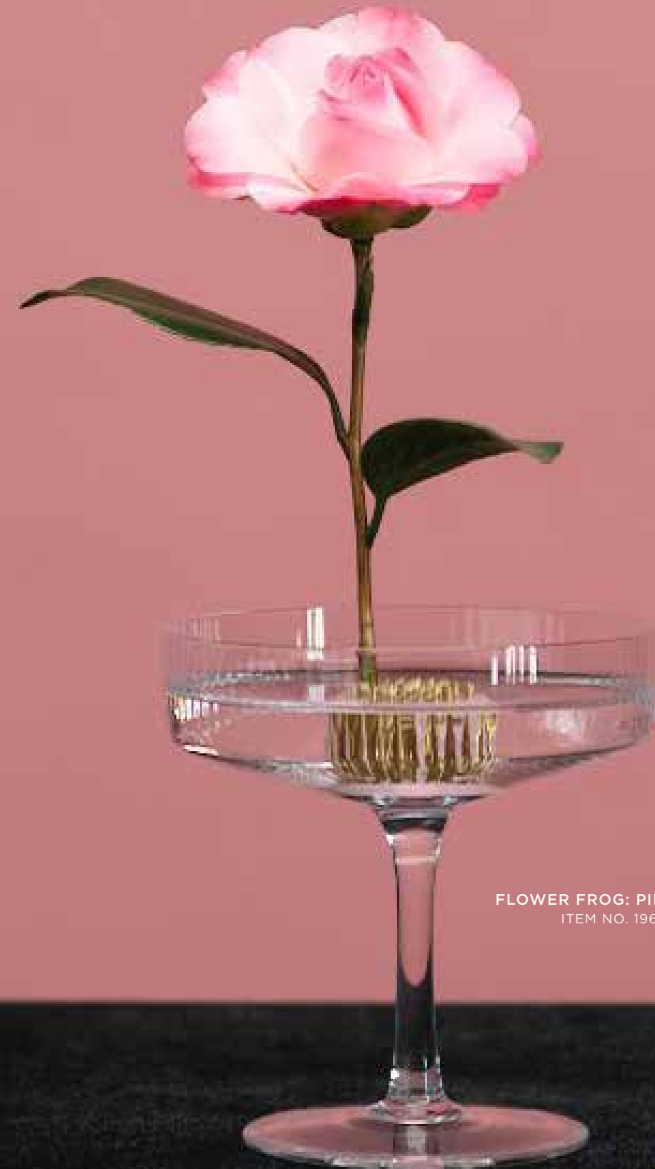
FLOWER FROG: PINK SMALL ITEM NO. 19632

SIZE: LARGE: Internal Ø: 3.15 INCHES/ 80mm MEDIUM Internal Ø: 1.97 INCHES/ 50mm SMALL Internal Ø: 1.34 INCHES/ 34mm