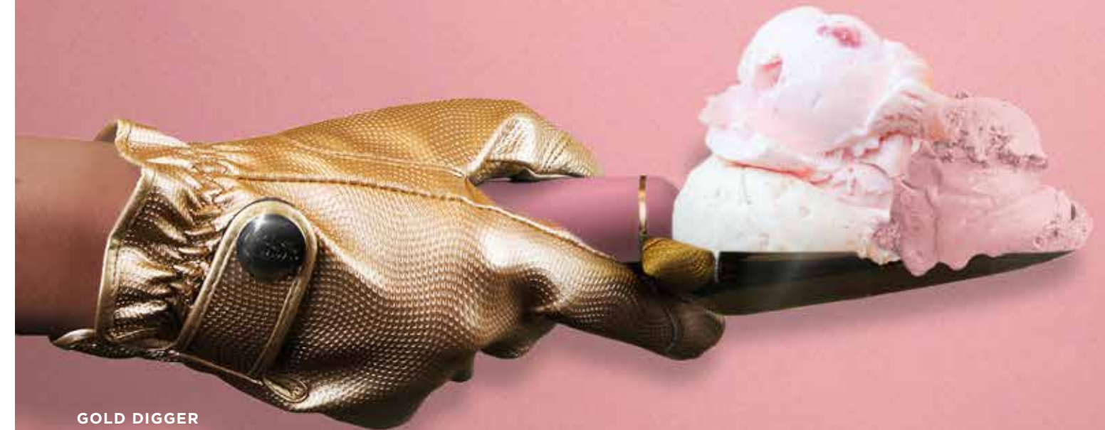
GOLD DIGGER GARDEN GLOVE ITEM NO. 95 (S) ITEM NO. 96 (M) ITEM NO. 97 (L) ITEM NO. 192 (XL)