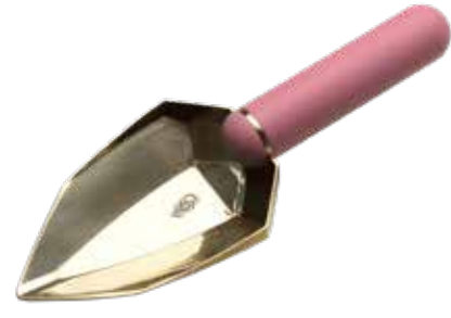
RUSTY ROSÉ ITEM NO. 108

US. Like all our products, the garden spades are our own design with blades in solid brass. For handles, we have chosen compression-molded plastic – simply because it is more durable than wood, and warmer to touch than steel.