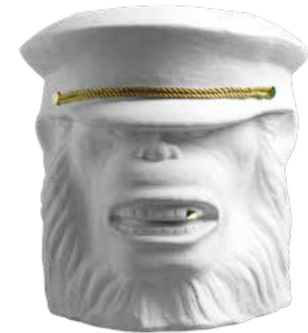
MONKEY FACE - WHITE ITEM NO. 179

US. This unique, sculpture-like pot in a black finish is made of terracotta and features an ear piercing made of brass with the Garden Glory logo on it. The pot comes with a stylish bag containing a brush and black paint to improve the finish if necessary as the years go by.