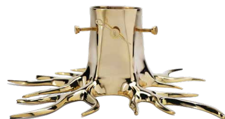
GOLD - MADE OF SOLID BRASS ITEM NO. 149