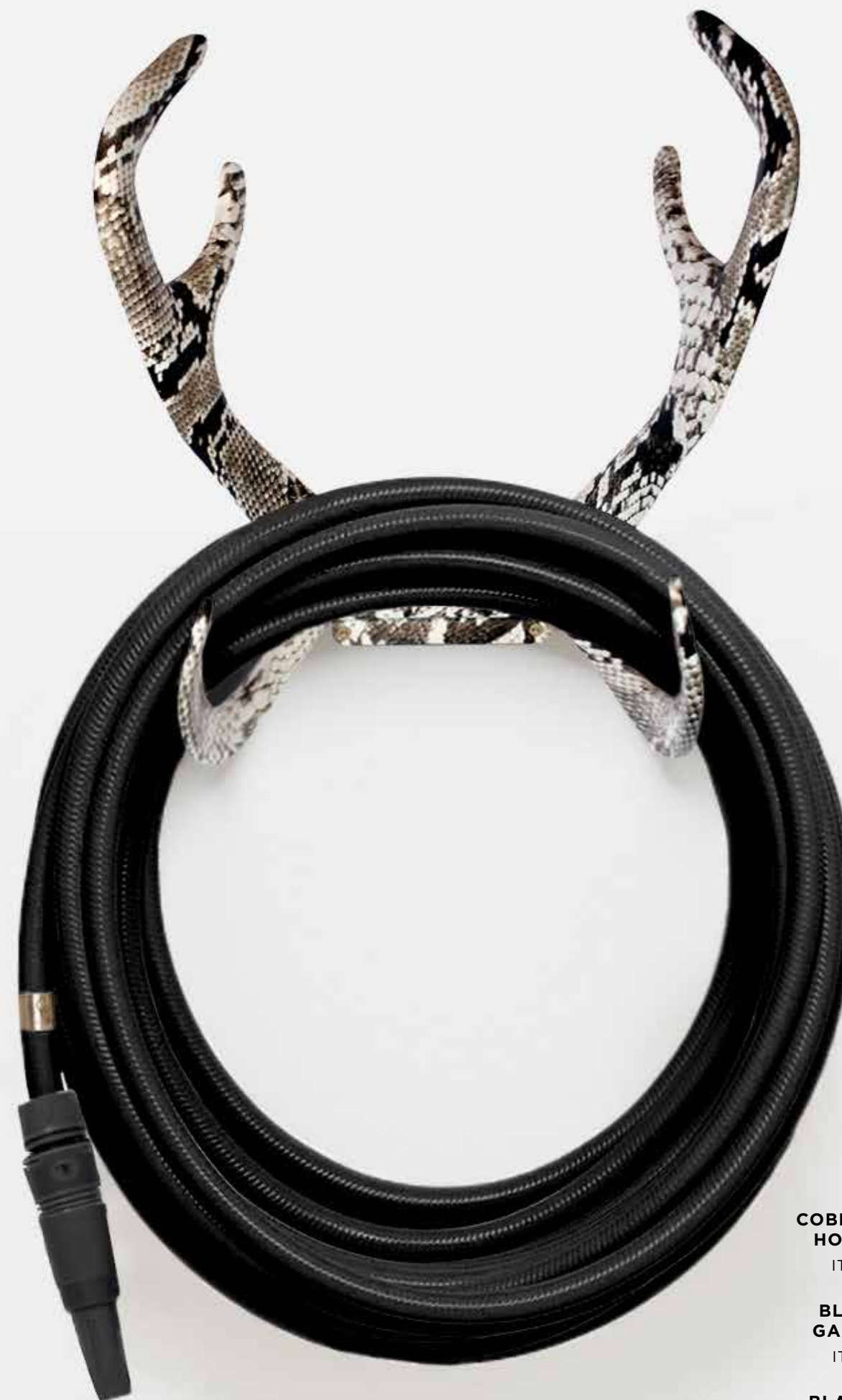
COBRA REINDEER HOSE HOLDER ITEM NO. 131