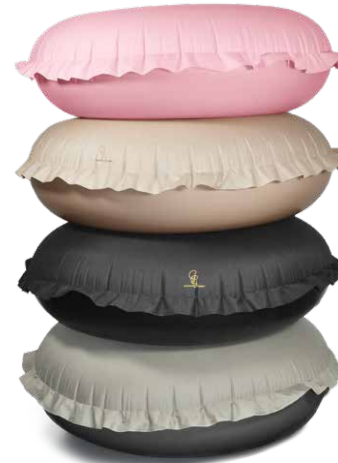
PINK ITEM NO. 19762