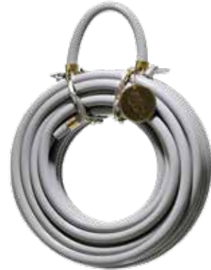
GRACEFUL ROCK ITEM NO. 04