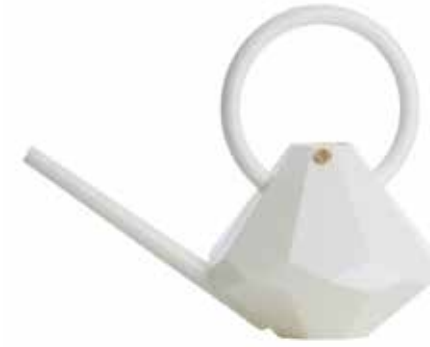
CRYSTAL ITEM NO. 55

FR. Cette pomme d'arrosoir est notre produit chouchou. Elle permet de nourrir jeunes pousses et fleurs avec tout plein d'amour. Moulé en laiton massif, cet arrosoir ne risque pas d'abîmer les tiges tendres ni d'inonder vos pots suspendus. Avec ses petits trous en forme de cœurs, vous donnerez une bonne dose d'amour à vos plantes. C'est parti, arrosez !