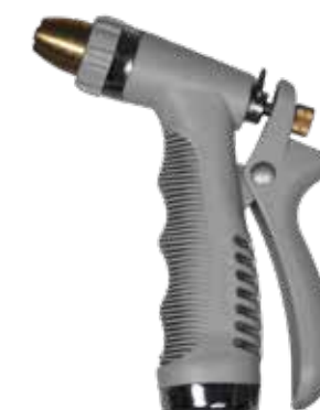
SPRAY GUN GRACEFUL ROCK ITEM NO. 19653