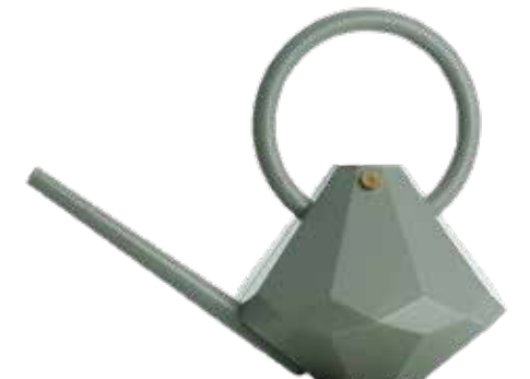
EUCALYPTUS ITEM NO. 165