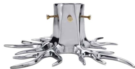
SILVER ITEM NO. 141