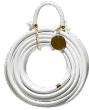
WHITE SNAKE ITEM NO. 01