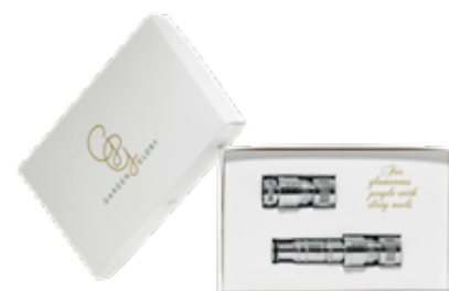
SILVERBULLET DELUXE ITEM NO. 23