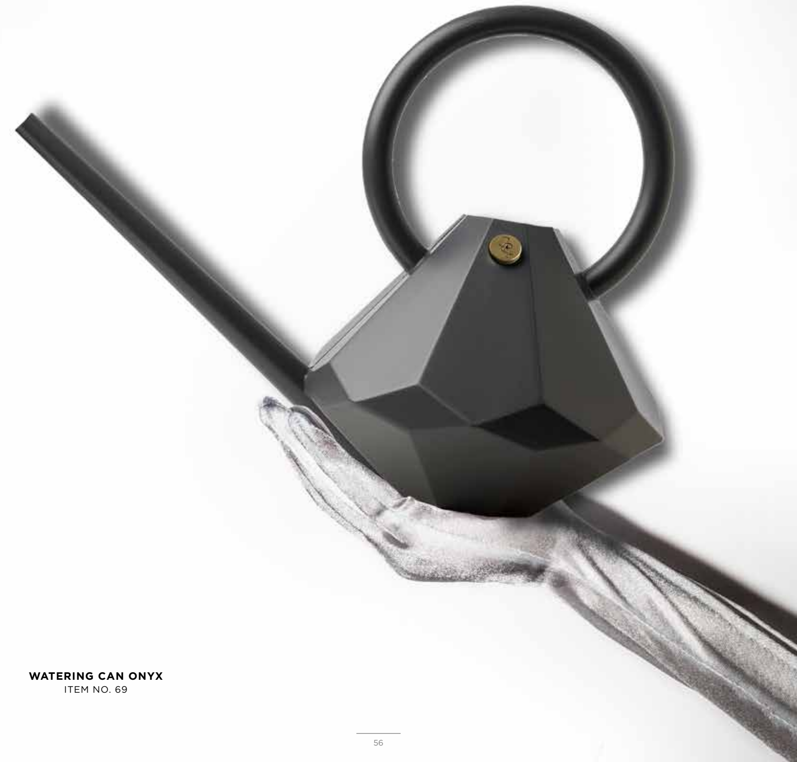
WATERING CAN ONYX ITEM NO. 69

HAUTEUR: 32 cm/12.6 inches LARGEUR (bec inclus): 42 cm VOLUME: 4 litres