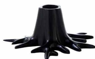
MATTE BLACK ITEM NO. 168

US. A natural, organically formed Christmas tree foot that compliments your tree perfectly. With its twisting, mesmerising root design and strong, stable construction, it's sassy, sexy and already destined to become a holiday classic. Order now and enjoy lots of compliments from your Christmas guests this year and many more to come. Available in silver, cream white or matt black.