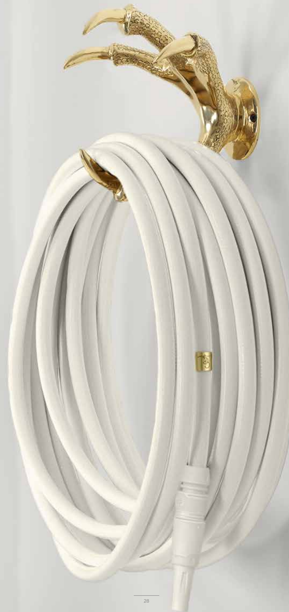
GOLD CLAW HOSE HOLDER ITEM NO. 106

DIMENSIONS: 21x20x16 cm/8x8x6 inches. POIDS: 3 kilos