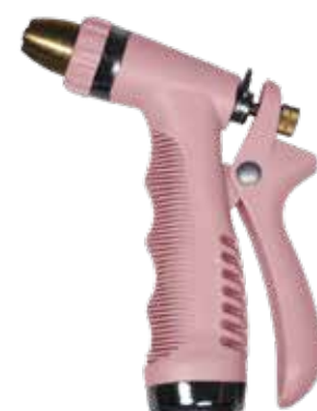
SPRAY GUN RUSTY ROSE ITEM NO. 19645