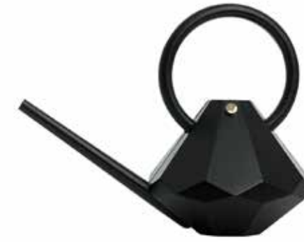
ONYX ITEM NO. 56