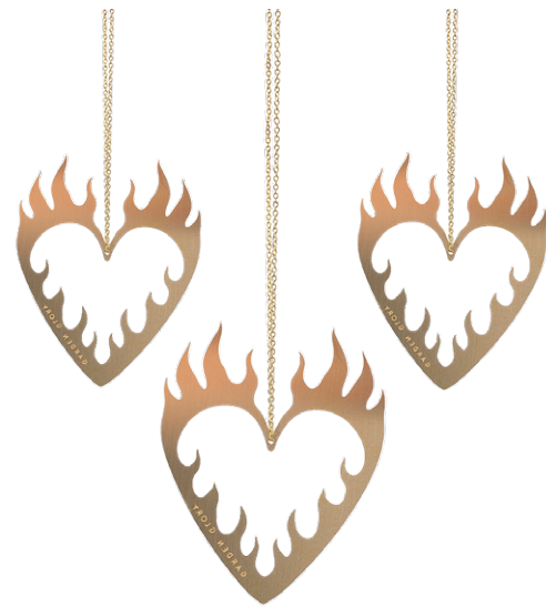
GOLD - MADE OF SOLID BRASS ITEM NO. 170