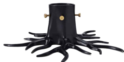
MATTE BLACK ITEM NO. 142