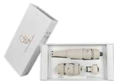
WHITE SNAKE ITEM NO. 06