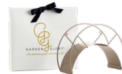
SAHARA DESERT ITEM NO. 19531

US. Our graceful Classic wall mounts are made of iron and aluminum. They have been powder coated and serve as the icing on the cake when mounted on the facade of the house.