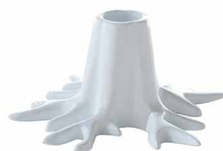
GLOSSY WHITE ITEM NO. 167