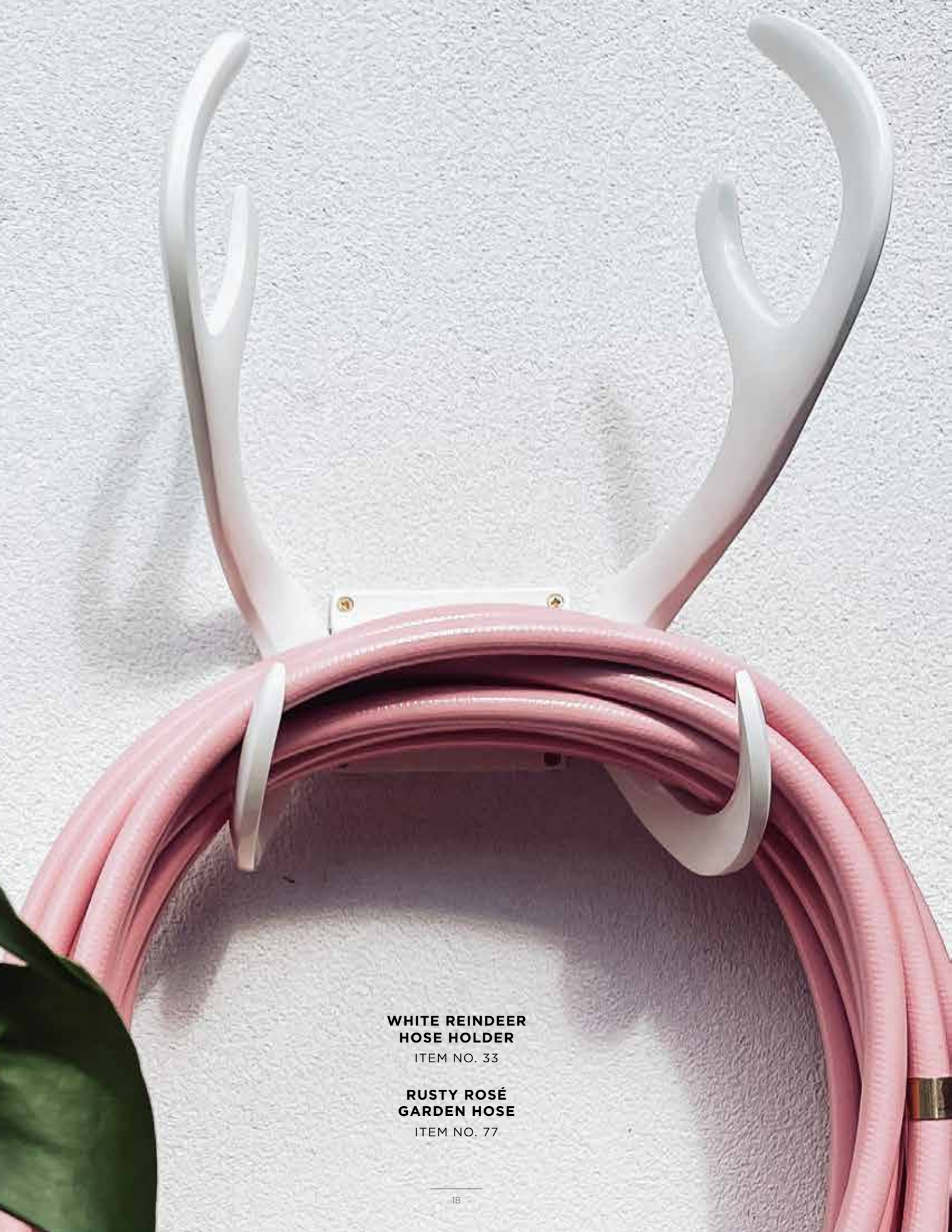
WHITE REINDEER HOSE HOLDER ITEM NO. 33