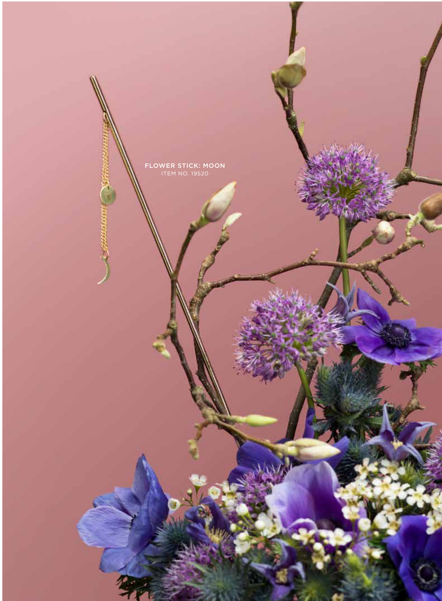
FLOWER STICK: MOON ITEM NO. 19520