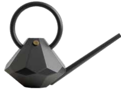
GRAPHITE ITEM NO. 69