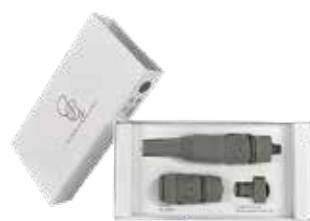
EUCALUPTUS LEAF ITEM NO. 129