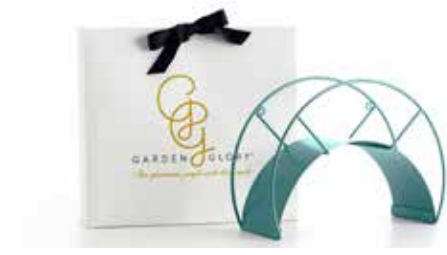
CARIBBEAN KISS ITEM NO. 43