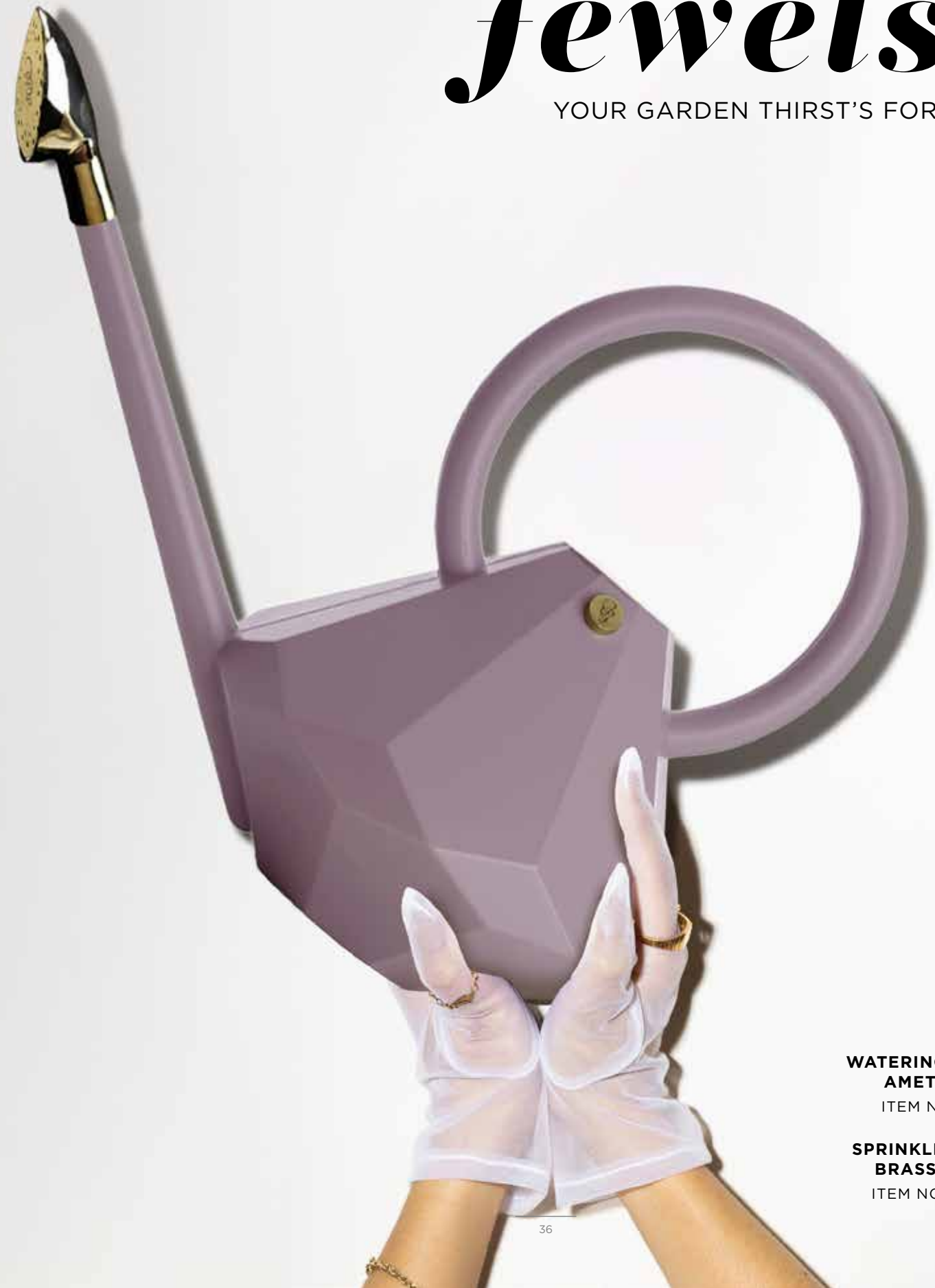
WATERING CAN 8L AMETHYST ITEM NO. 198