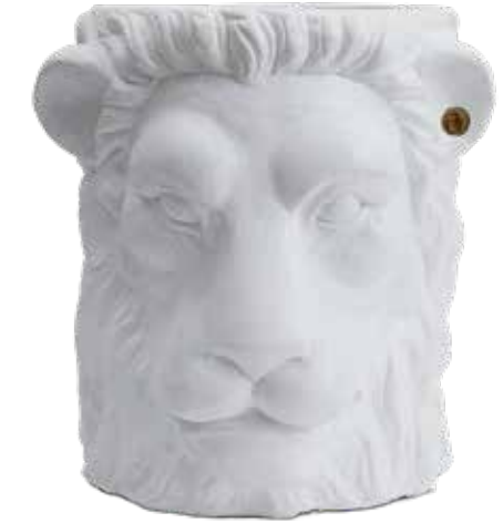
WHITE ITEM NO. 93