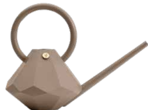
SAND ITEM NO. 19528