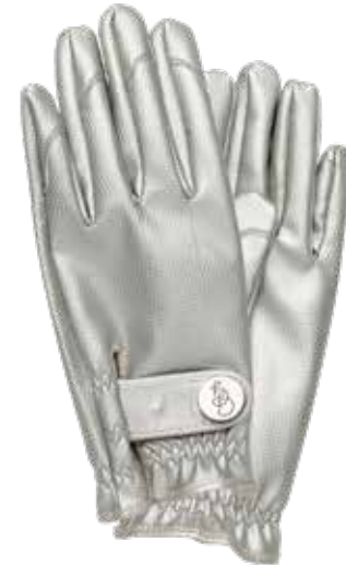
SILVER BULLET ITEM NO. 98 (S) ITEM NO. 99 (M) ITEM NO. 100 (L) ITEM NO. 193 (XL)