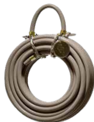
SAHARA DESERT ITEM NO. 19529

US. Our hoses are of the highest quality and made in Scandinavia. The knitting reinforcement around the inner tube makes them pliable and non-kinking. The plastic surface is dirt repellent and UV-protected to prevent bleaching from sun exposure. All our hoses are made of PVC and free from lead, cadmium and phosphates.