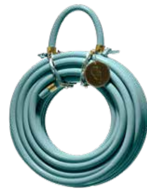
CARIBBEAN KISS ITEM NO. 39