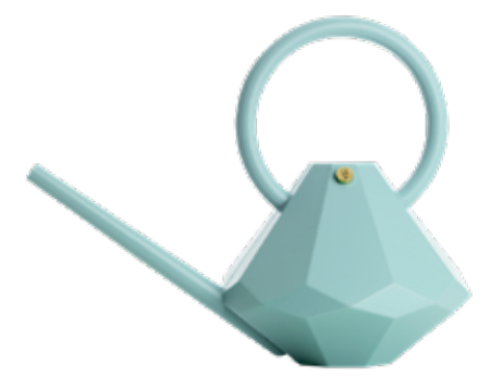
JADE ITEM NO. 59