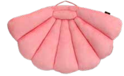
ROSÉ ITEM NO. 103