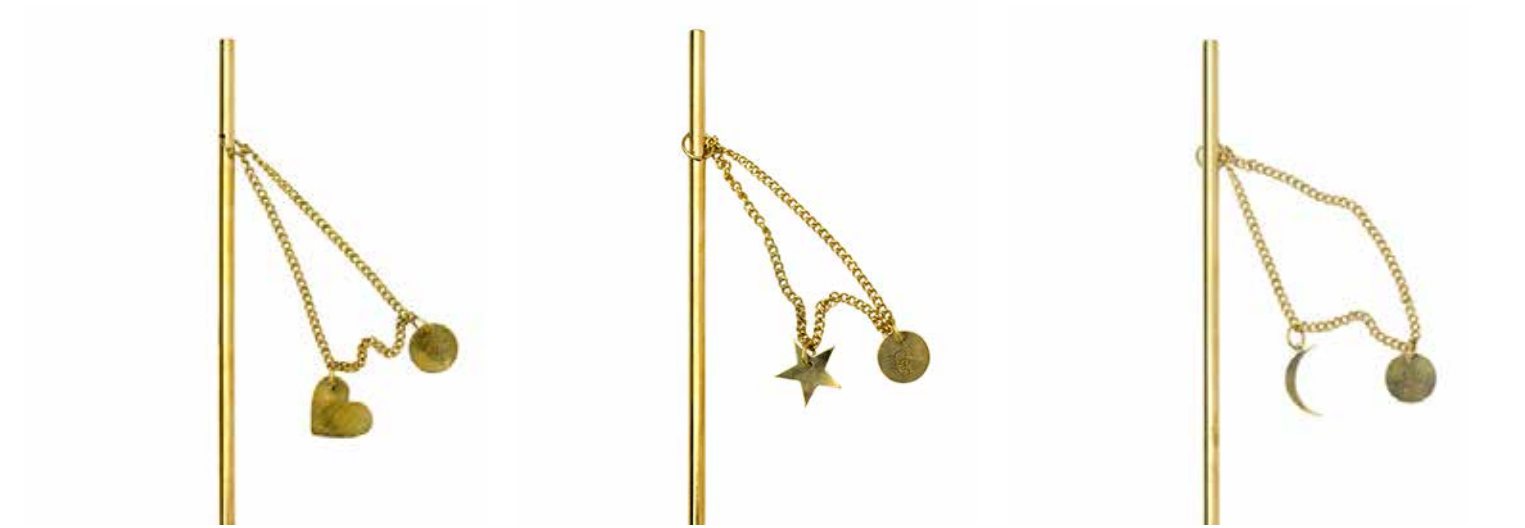
HEART ITEM NO. 19519