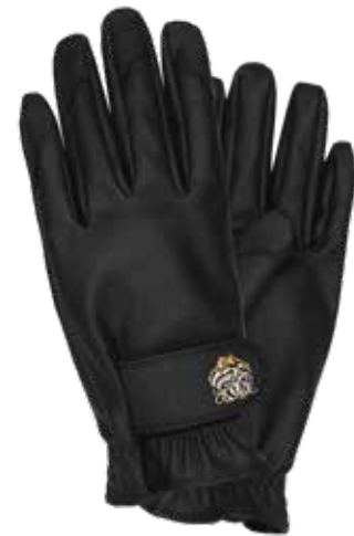
SPRKLING BLACK ITEM NO. 189 (S) ITEM NO. 190 (M) ITEM NO. 191 (L)