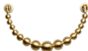
BRUSHED BRASS ITEM NO. 19515

US. This Pearl Ribbon door knocker is the perfect addition of elegance and poise for your door. Cast in solid brass and hand-finished, the Door Knockers are unmatched in quality and craftsmanship. They come in four versions, polished brass, brushed brass, powder coated black and chrome plated silver look. The hardware and mounting instructions are included in its packaging.