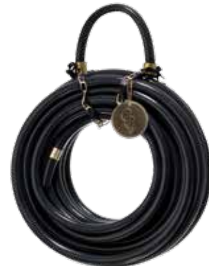
BLACK SWAN ITEM NO. 02