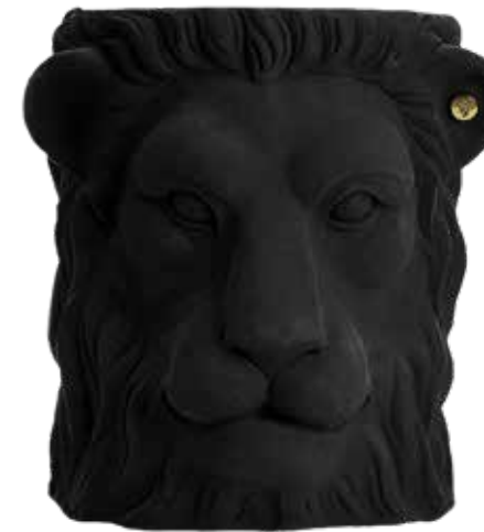
BLACK ITEM NO. 66