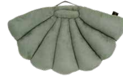
EUCALYPTUS ITEM NO. 102