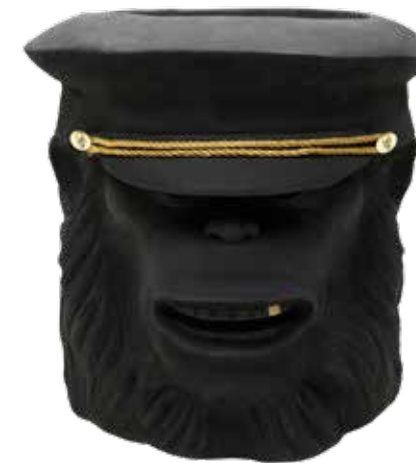
MONKEY FACE ITEM NO. 76