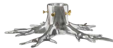
CHRISTMAS TREE STAND LARGER ITEM NO. 19505