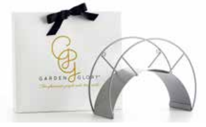
GRACEFUL ROCK ITEM NO. 30