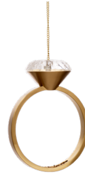
DIAMOND BIRD FEEDER ITEM NO. 116