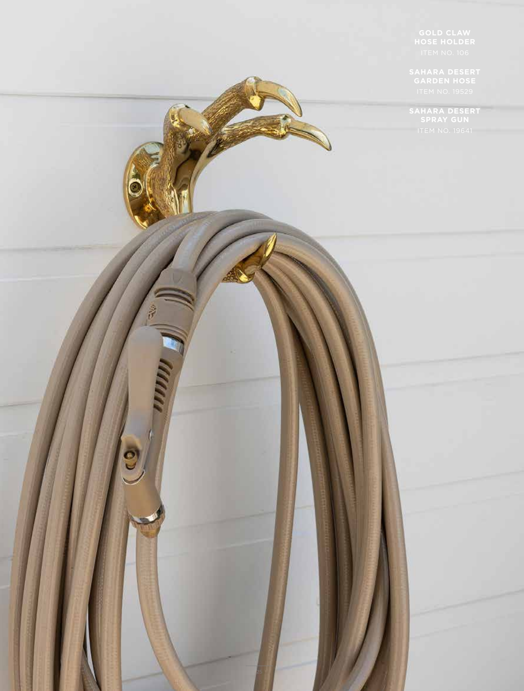
GOLD CLAW HOSE HOLDER ITEM NO. 106