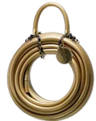
GOLD DIGGER DELUXE ITEM NO. 05