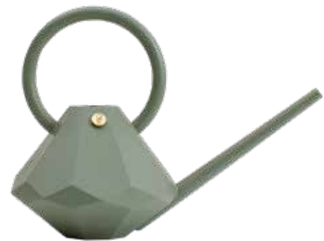
EUCALYPTUS ITEM NO. 90