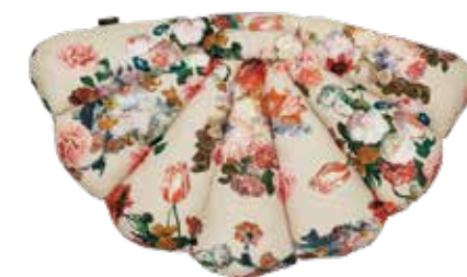
FLOWER ITEM NO. 132

US. The inspiration for this exclusive velvet cushion came while collecting seashells at the beach. You can open it for extra back support and fold it up again for storage. Designed for the outdoors, the cushion is filled with water-repellent foam and is perfect for a garden chair or bench. Comes in 4 exciting design - Eucalyptus Green, Rusty Rose, Black and Flower.