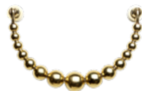
POLISHED BRASS ITEM NO. 19514