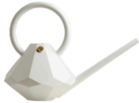
PEARL ITEM NO. 68