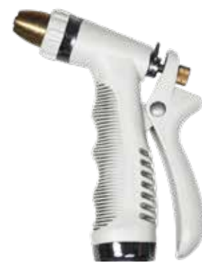
SPRAY GUN WHITE SNAKE ITEM NO. 19642