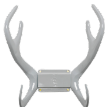
GREY ITEM NO. 34