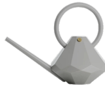
GRACE ITEM NO. 58