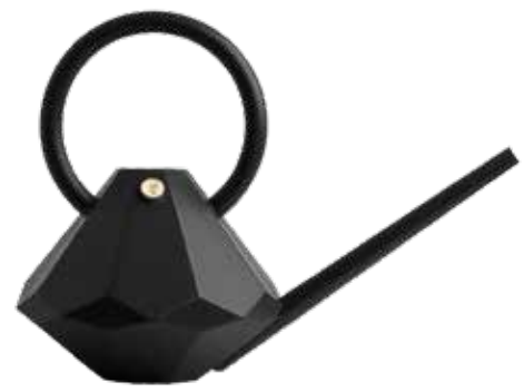
ONYX ITEM NO. 69

US. This diamond-shaped little gem, made of blownmolded plastic, will bring a touch of sophistication to any room. It comes in three exciting colors: Graphite, Rosé and Pearl. And for an elegant touch, it features a brass button embossed with the Garden Glory logo. Made in Sweden.