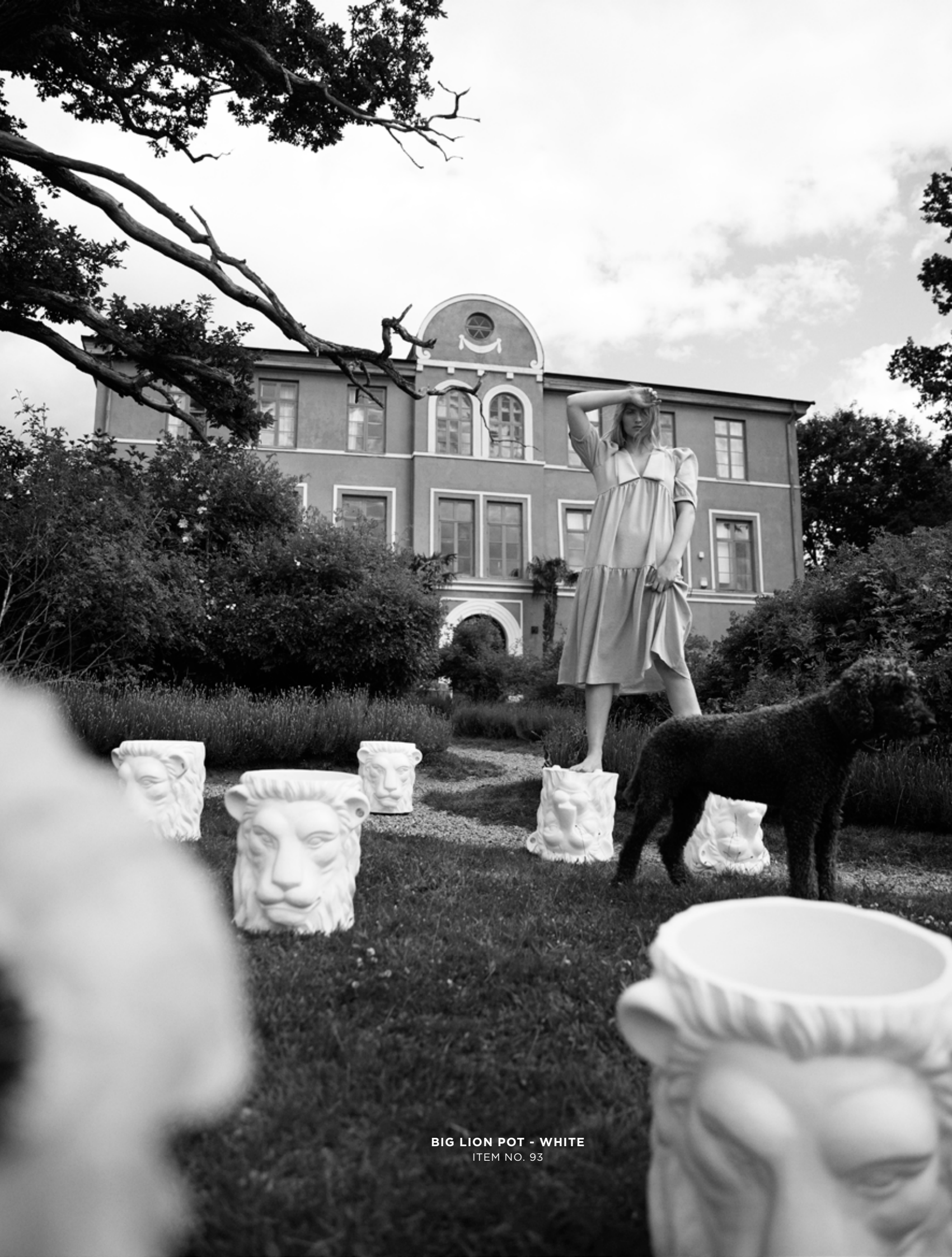
BIG LION POT - WHITE ITEM NO. 93