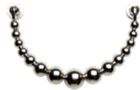
SILVER ITEM NO. 19517