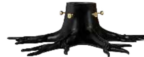
CHRISTMAS TREE STAND LARGER ITEM NO. 19629