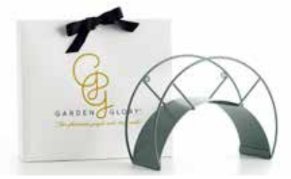
EUCALYPTUS LEAF ITEM NO. 128