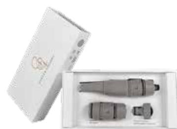
GRACEFUL ROCK ITEM NO. 09