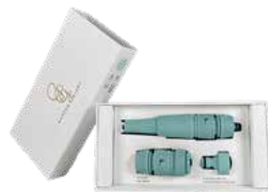
CARIBBEAN KISS ITEM NO. 41