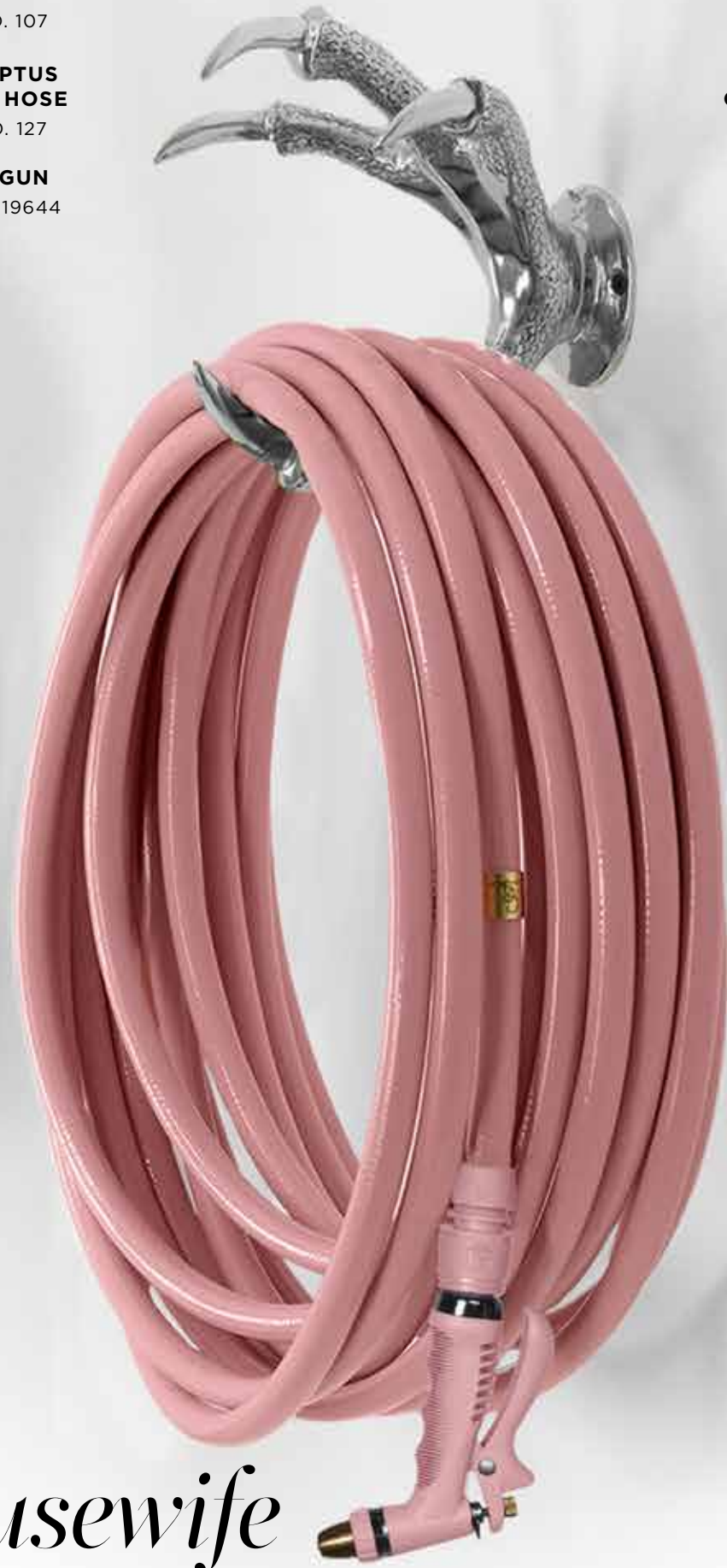
SILVER CLAW HOSE HOLDER ITEM NO. 107