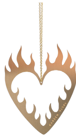
SILVER ITEM NO. 169