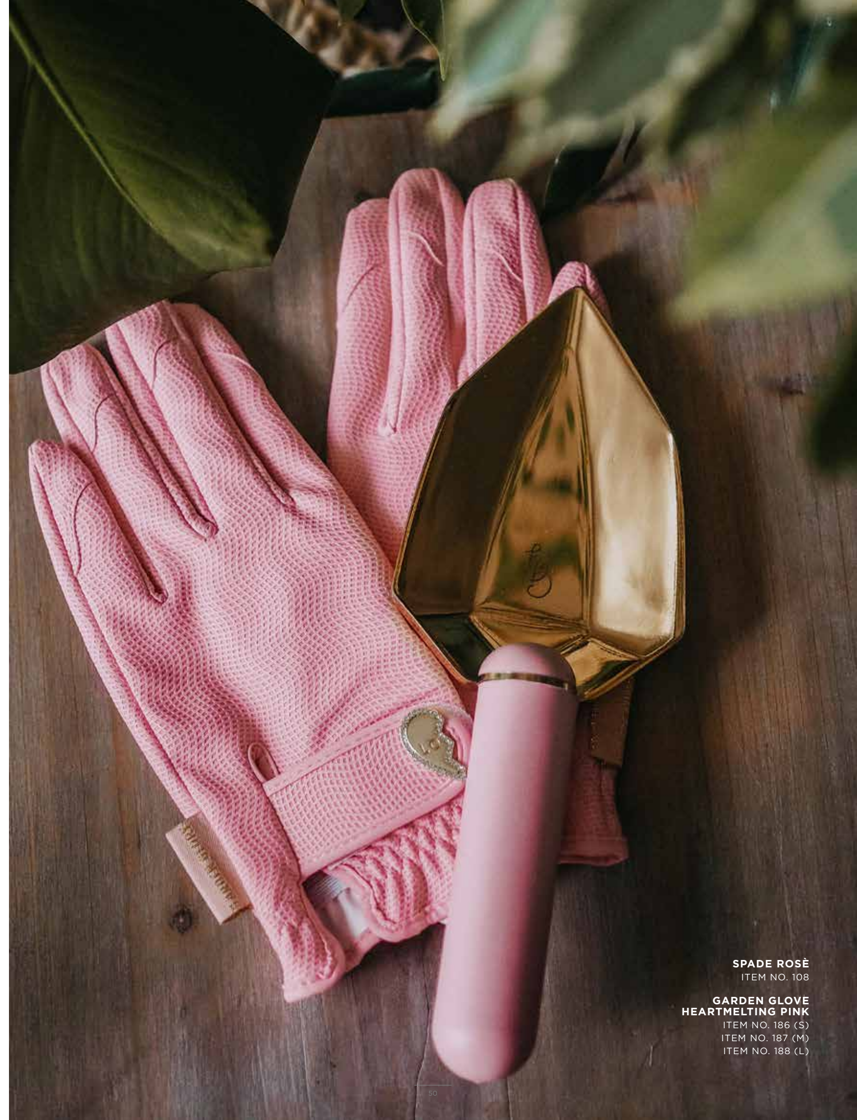
SPADE ROSÉ ITEM NO. 108

FR. Nous concevons nous-mêmes tous nos produits, et les pelles de jardin ne font pas exception. La pelle est fabriquée en laiton et son manche est en plastique moulé par injection. En effet, le plastique est plus résistant que le bois, mais aussi plus chaud sous les doigts que l'acier.