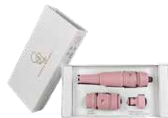
RUSTY ROSÉ ITEM NO. 78