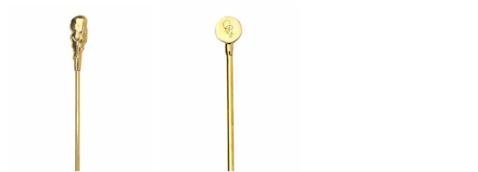
ORGANIC ITEM NO. 19521