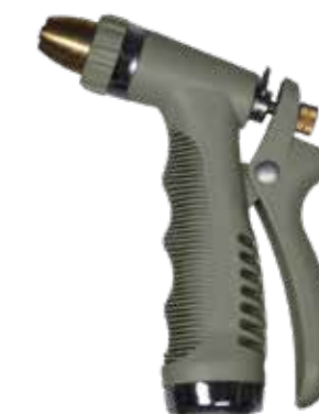
SPRAY GUN EUCALYPTUS LEAF ITEM NO. 19644