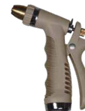
SPRAY GUN SAHARA DESERT ITEM NO. 19641

US. Adjustable from a soft mist to a hard jet, this spray gun is perfect for everything from brightening up patios to dowsing delicate roses in full bloom. It can also be locked for ease of watering and its attachments can be easily swapped out without getting soaking wet.