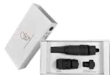
BLACK SWAN ITEM NO. 07