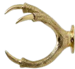
GOLD ITEM NO. 106