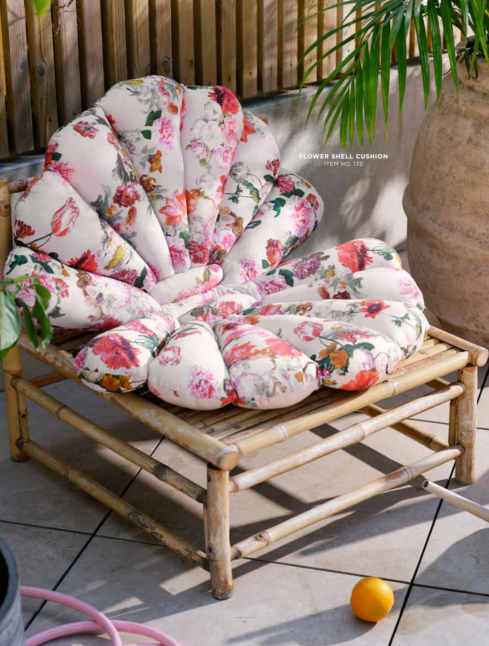
FLOWER SHELL CUSHION ITEM NO. 132