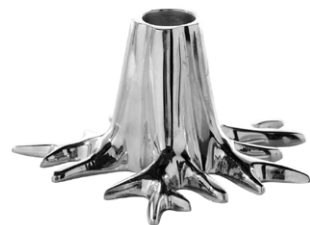
SILVER ITEM NO. 169