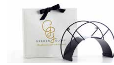
BLACK SWAN ITEM NO. 28