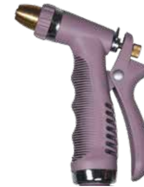
SPRAY GUN PURPLE RAIN ITEM NO. 19646