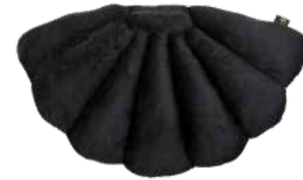
BLACK ITEM NO. 104