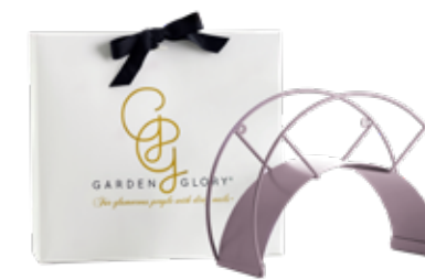
PURPLE RAIN ITEM NO. 196