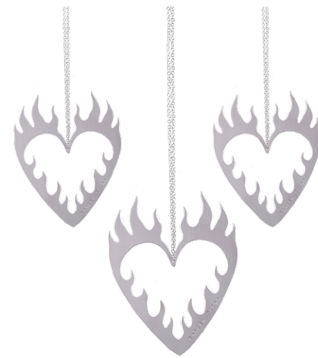
MATTE BLACK ITEM NO. 168

US. Set hearts aflame with this tree topper. Available in both silver and gold, they're the perfect match to our Root Tree Stands and Candle Holders and are sure to give your Christmas tree a little extra sparkle. Whether for your own tree or as a gift, these long-lasting tree decorations are a golden opportunity to capture your loved ones' hearts, and, even after all the presents have been opened, the silver lining that will keep your Christmas tree twinkling.