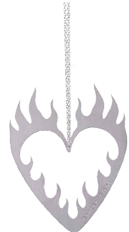
GLOSSY WHITE ITEM NO. 167