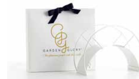
WHITE SNAKE ITEM NO. 27