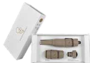
SAHARA DESERT ITEM NO. 19530