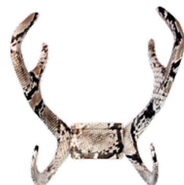
COBRA ITEM NO. 131

US. The Reindeer wall mount is our crowning achievement and a perfect fit anywhere. The antlers - designed and manufactured in Sweden - are cast in aluminum and made to endure hard weather conditions. They come with a 5-year warranty.