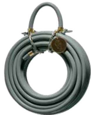
EUCALYPTUS LEAF ITEM NO. 127