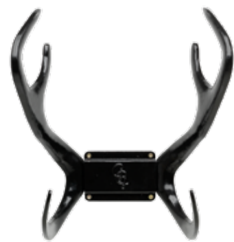
BLACK ITEM NO. 32