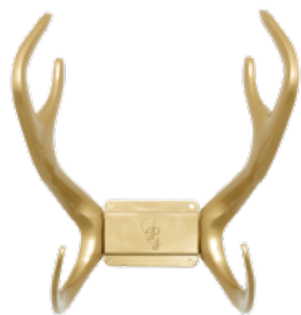
GOLD ITEM NO. 31