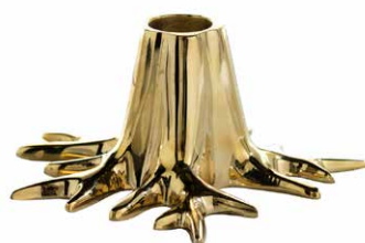
GOLD - MADE OF SOLID BRASS ITEM NO. 170