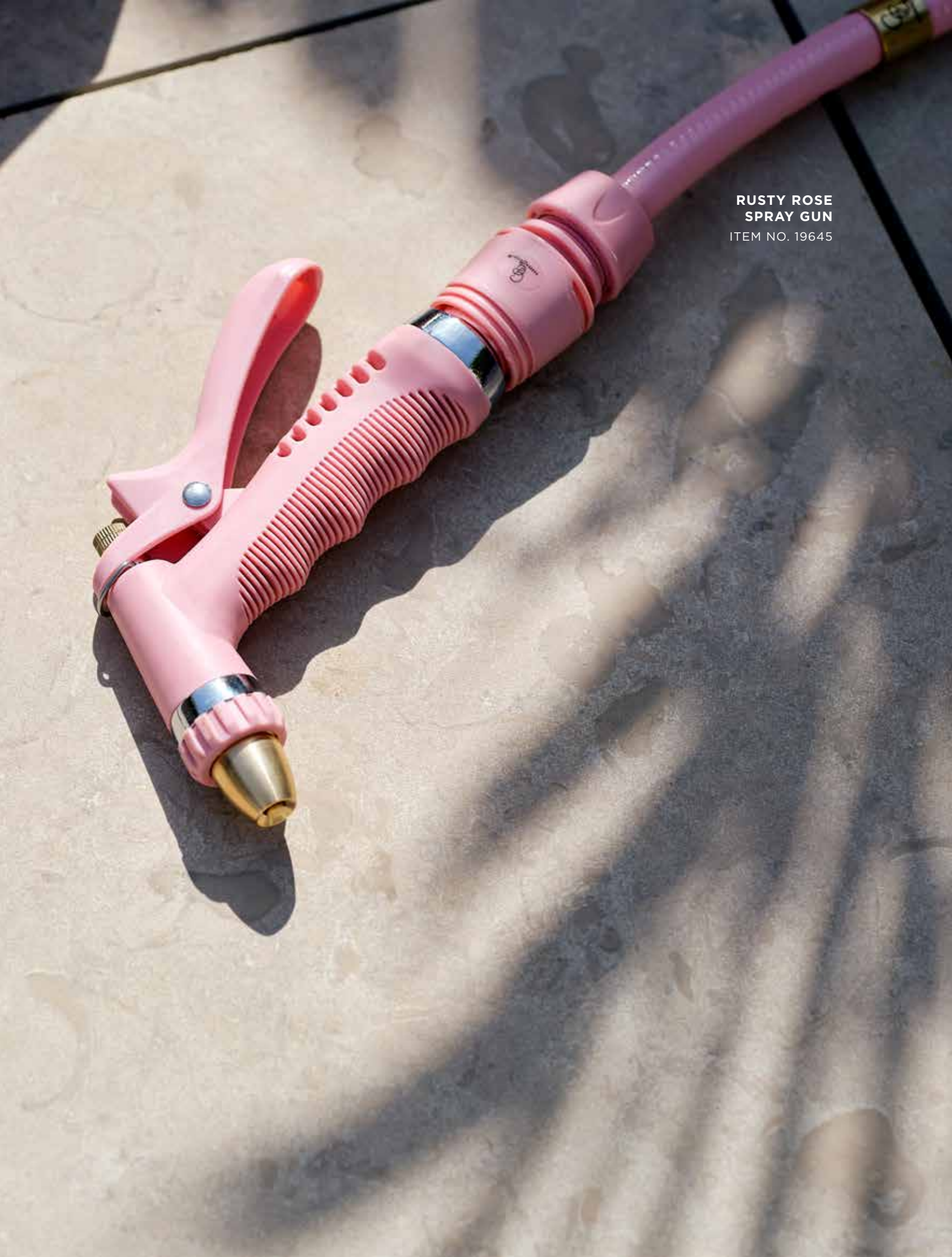
RUSTY ROSE SPRAY GUN ITEM NO. 19645