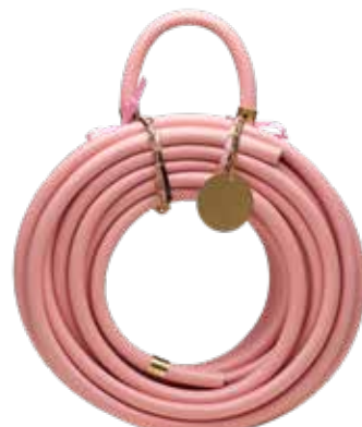
RUSTY ROSÉ ITEM NO. 77