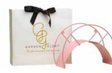
RUSTY ROSÉ ITEM NO. 79