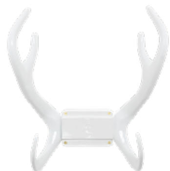
WHITE ITEM NO. 33