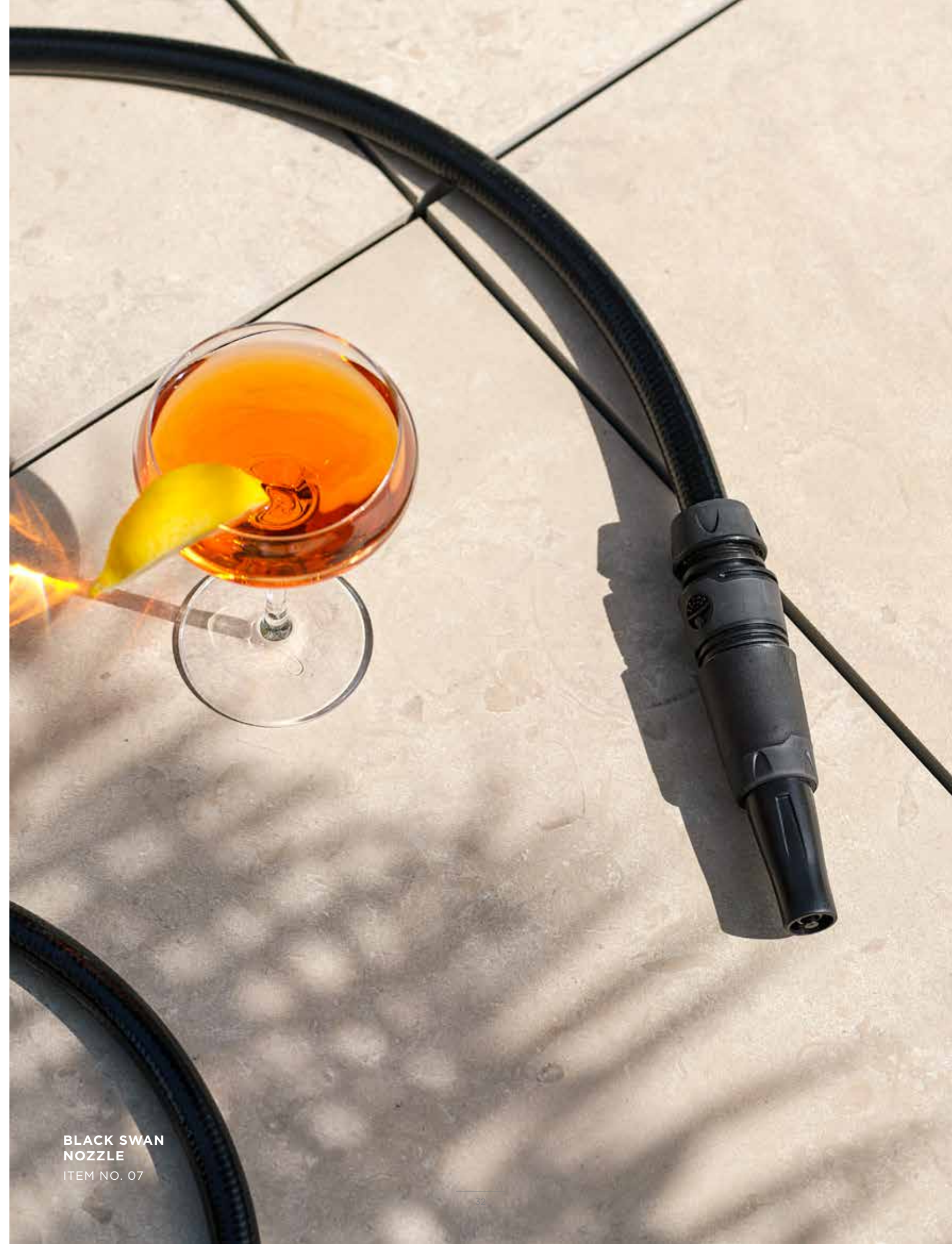
BLACK SWAN NOZZLE ITEM NO. 07

DELUXE. Unsere Messing- und Chromdüsen sind Teil der DeLuxe-Kollektion. Sie werden in Schweden hergestellt und passen perfekt zu allen unseren Schlauch- und Wandbefestigungskombinationen. Wählen Sie beim Bewässern zwischen Wasserstrahl, weichem Regen oder Nebel. Diese Düsen sind langlebig und werden mit Anmut und Charme altern.