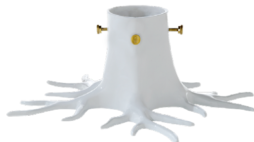
CRÈME WHITE ITEM NO. 143

US. At last! A natural, organically formed Christmas tree foot that compliments your tree perfectly. With its twisting, mesmerising root design and strong, stable construction, it's sassy, sexy and already destined to become a holiday classic. Order now and enjoy lots of compliments from your Christmas guests this year and many more to come. Available in silver, cream white or matt black.