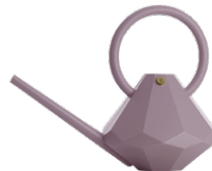
AMETHYST ITEM NO. 198