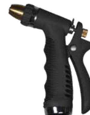
SPRAY GUN BLACK SWAN ITEM NO. 19643