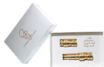
GOLD DIGGER DELUXE ITEM NO. 10

US. Our nozzle sets include all connectors needed to irrigate efficiently and elegantly.