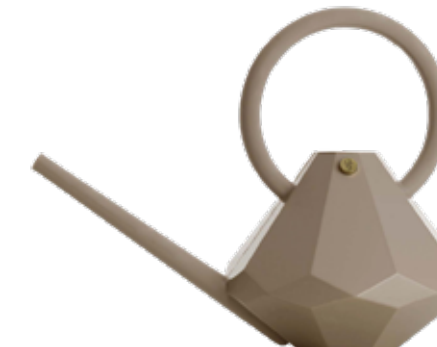
SAND ITEM NO. 19532

US. Exquisitely diamond-shaped and form-blown, our watering can will be the crown jewel of any garden. Either as a stand-alone centerpiece, or as the one object that ties the garden together. The plastic watering can holds up to 8 liters of water and comes in the same colors as our hoses.