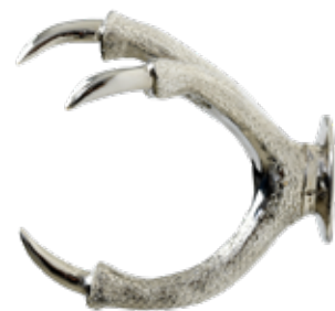
SILVER ITEM NO. 107

US. Inspired by the magnificent falcon, these wall mounts make a bold statement in any garden. Made of sand-molded brass, they come in either brass, chrome, or a black powder-coated brass finish. An absolute treasure.