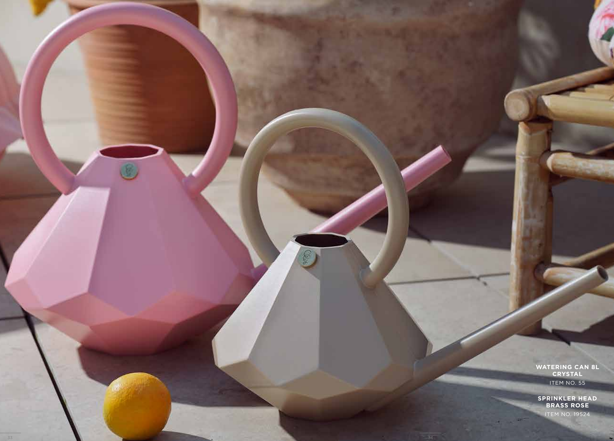
WATERING CAN 8L CRYSTAL ITEM NO. 55