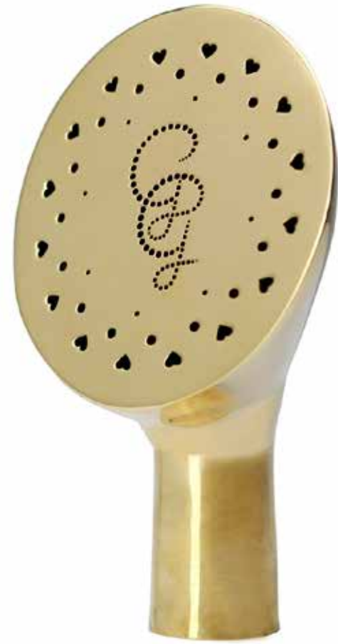
SPRINKLER HEAD: THE BRASS ROSE ITEM NO. 19524

US. A sprinkler head made of solid brass with perforated small holes and beautiful hearts for fine even spray. This one is made to fit our 8 liter Diamond watering can. Since the rose is made of brass it is heavier than the can itself when no water inside the can. Make sure to take it off and place it on top of the opening when no water inside the can or fill it up with water.