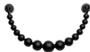
BLACK ITEM NO. 19516