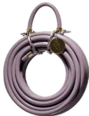
PURPLE RAIN ITEM NO. 195