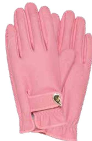
HEARTMELTING PINK ITEM NO. 186 (S) ITEM NO. 187 (M) ITEM NO. 188 (L)

US. Inspired by the big fashion houses and horse-riding gloves, these golden gems are not only gorgeous; they're also designed to fit your hand perfectly. Combining style and comfort, the gloves feature an elegant brass button and an adjustable wrist tab. The PU synthetic leather makes them stretchy as well as dirt and water repellent. Even the packaging is beautiful. Available in small, medium or large. Also available in silver featuring a stylish chrome button.