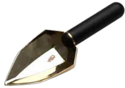
ONYX ITEM NO. 61